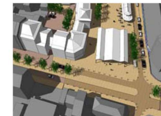
Vue depuis le sud vers la nouvelle place du marché.