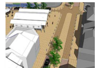
Vue vers le carrefour du Fer Rouge