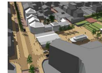
Vue depuis le carrefour du Fer Rouge