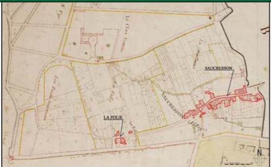
Plan historique de 1860